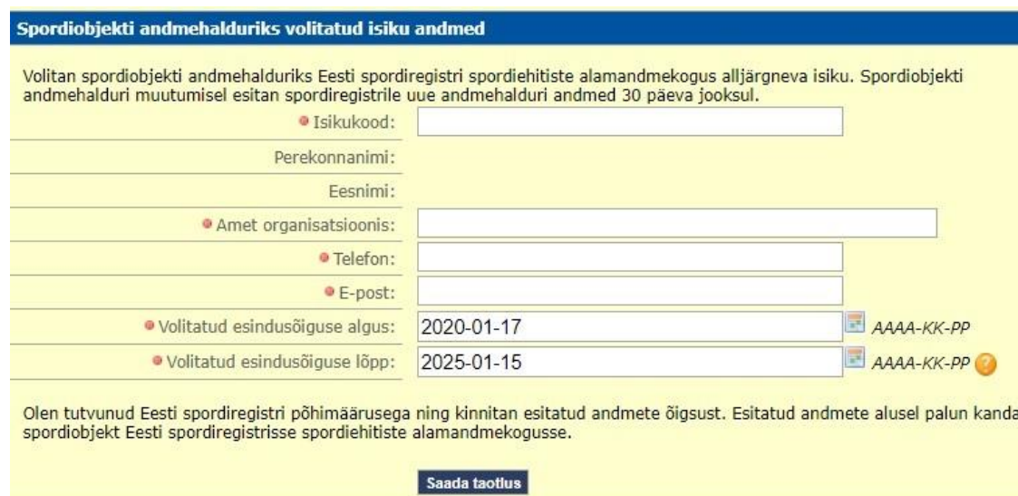
Joonis 3. Andmehalduri määramine

Andmehalduri määramisel tuleb sisestada isikukood, mille alusel loetakse andmed rahvastikuregistrist. Seejärel tuleb täita ülejäänud väljad. Volitatud esindusõiguse pikkus saab olla kuni 5 aastat (joonis 3). Seda piiri ületava ajavahemiku korral kuvatakse veateade.