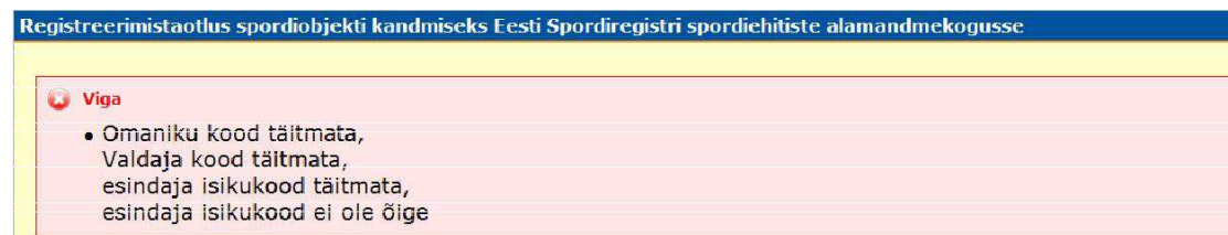
Joonis 4. Mitu veateadet

Kui viga ei esinenud, siis vorm suletakse ning kuvatakse teade “Taotlus on saadetud”. Taotlus vaadatakse läbi 5 tööpäeva jooksul. Menetlusotsusest teavitatakse taotlejat e-kirja teel. Taotluse esitamisest loobumisel viib link